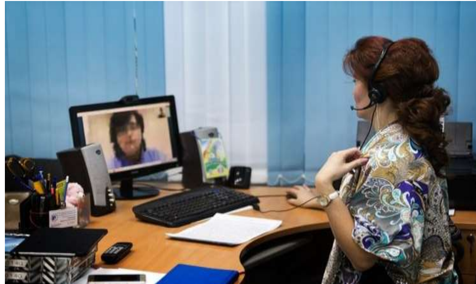
Оператор центра видеосвязи для глухих